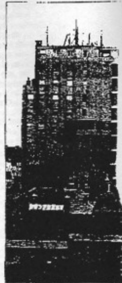
Instalación de una antena en la ciudad.